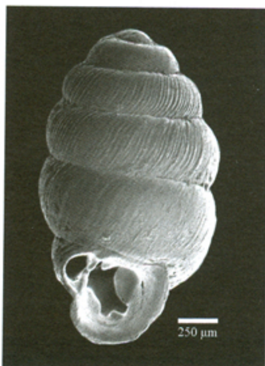
Fig. 1. Ejemplar de V. angustior de la localidad valenciana de Sinarcas.

La nueva población valenciana se localiza en el término de Sinarcas (UTM: 30SXK50; 810 m) en una parcela de propiedad privada, junto a las surgencias y canales que suministran agua a una chopera con fines comerciales. Se ha encontrado principalmente debajo de troncos y