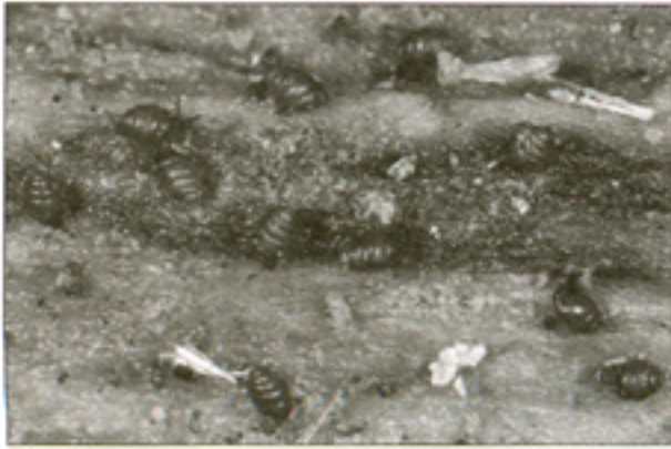
Fig. 2. Aspecto de la población de V. angustior de Sinarcas (Valencia).

Carychium tridentatum (Risso, 1826), Oxyloma elegans (Risso, 1826), Vallonia costata (O.F. Müller, 1774), Acanthinula aculeata (O.F. Müller, 1774), Truncatellina sp., Merdigera obscura (O.F. Müller, 1774), Paralaoma servilis (Shuttleworth, 1852), Euconulus fulvus (O.F. Müller, 1774), Vitrina pellucida (O.F. Müller, 1774), Oxychilus draparnaudi (Beck, 1837), Zonitoides nitidus (O.F. Müller, 1774), Lehmannia valentiana (Férussac, 1823), Deroceras laeve (O.F. Müller, 1774), D. reticulatum (O.F. Müller, 1774), Arion intermedius Normand, 1852, Monacha cartusiana (O.F. Müller, 1774), Xerosecta arigonis (A. Schmidt, 1854) y Cornu aspersum (O.F. Müller, 1774); mientras que en la zona de la solana con vegetación mediterránea: Granaria braunii braunii (Rossmässler, 1842), Jaminia quadridens (O.F. Müller, 1774) y Pseudotachea splendida (Draparnaud, 1801)