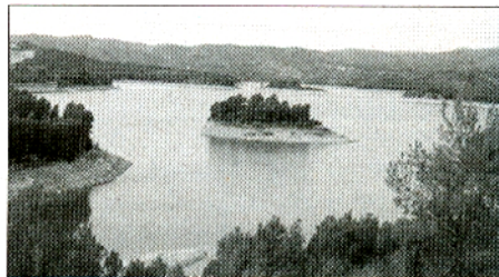
Embalse de Sitjar (Castellón)

en el embalse. Por el momento no ha sido detectado aguas abajo del mismo, aunque parece imposible evitarlo dado el gran potencial de reproducción y colonizador de esta especie.