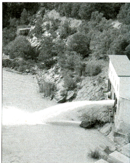
Compuerta de salida del embalse al río Mijares